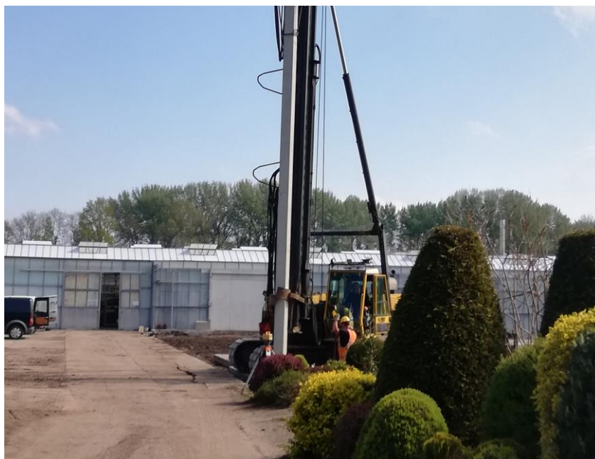
De eerste paal wordt geslagen op vrijdag 22 april 2022

Hoewel de voorbereiding al jaren gaande is, heet het slaan van de eerste paal de officiële start van de nieuwbouw. Vrijdag 22 april vond deze heugelijke gebeurtenis plaats.