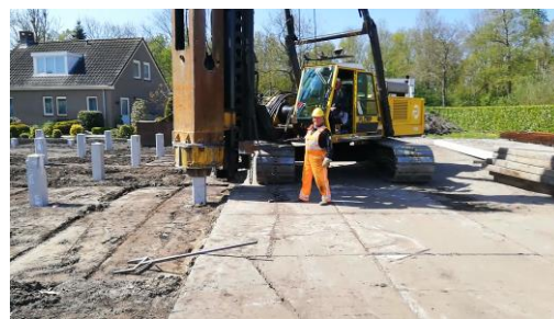
Vakmensen van Plomp Funderingstechnieken en EKAL voeren de klus uit

In totaal zijn 109 palen geslagen. 1175 m, 176.250 kg is de grond in gestampt. Donderdag 28 april om 12:12 uur ging de laatste paal de grond in. De palen zijn bijzondere palen, nl. energiepalen, ook wel 'de groene paal' genoemd. De palen hebben naast hun constructieve functie ook een cruciale rol in de energiehuishouding van het gebouw. Zij fungeren als grondbron en zullen de energie leveren om het hele gebouw in de toekomst te verwarmen en koelen. Deze techniek is nog redelijk nieuw in Nederland, maar wordt steeds vaker, veelal binnenstedelijk, toegepast. Rebra/Encsy is gecertificeerd voor ontwerp, realisatie en beheer en onderhoud van o.a. dit type grondbron.